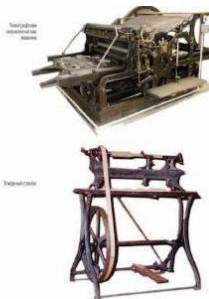
Рис. продукция завода – из фондов музея МГТУ им. Н.Э. Баумана