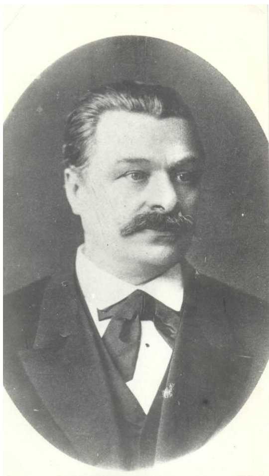
Фото В.К. Делла-Воса фондов музея МГТУ им. Н.Э. Баумана

принуждены будут энергически ему противодействовать. Это противодействие выразится в стремлении дать развитию заводской и мануфактурной промышленности в нашем Отечестве характер более самостоятельный, чем значительно ослабится его исключительная зависимость от иноземного влияния.