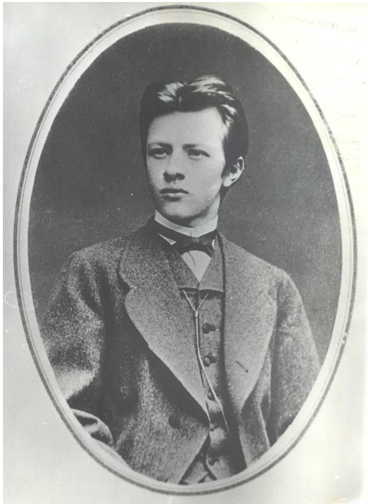
В.Г. Шухов в год окончания училища

Какой слог, какое обращение к бывшему выпускнику! И вот Шухов на целый год (!) пропадает в США, первым делом обозревая на пароконном дилижансе, как пишут авторы Повести о великом инженере , выставку: