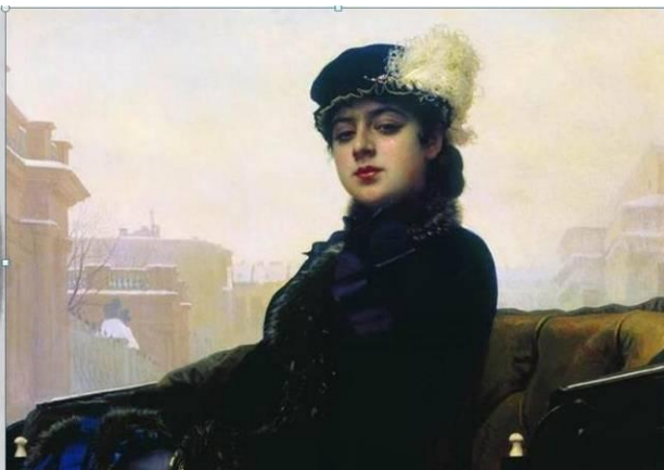
Картина И.Н. Крамского «Неизвестная»