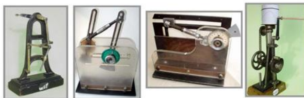
Рис. 6. Модели механизмов, которые используются в лабораторных работах по ТММ

Коллекция моделей механизмов на кафедре «Теория машин и механизмов» (ТММ) МГТУ им. Н.Э. Баумана – одна из крупнейших в мире. Начало ей было положено еще в XIX в. Здесь есть научные, учебные модели, модели типовых механизмов для демонстрации их на лекциях и семинарах, для выполнения лабораторных работ.